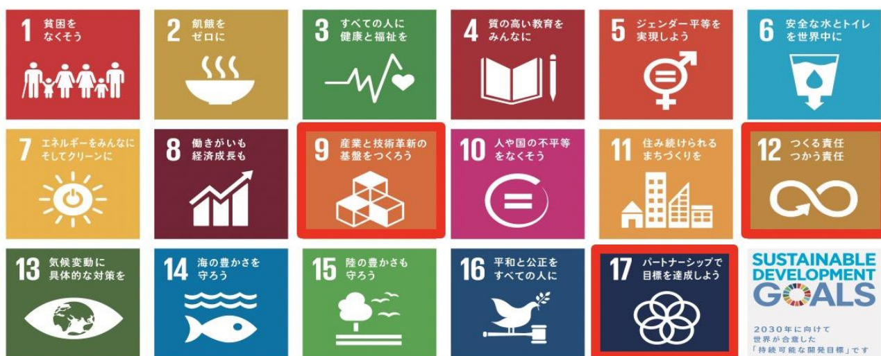
※参照元：平成 31 年 1 月外務省発表『「持続可能な開発目標」（SDGs）について』より